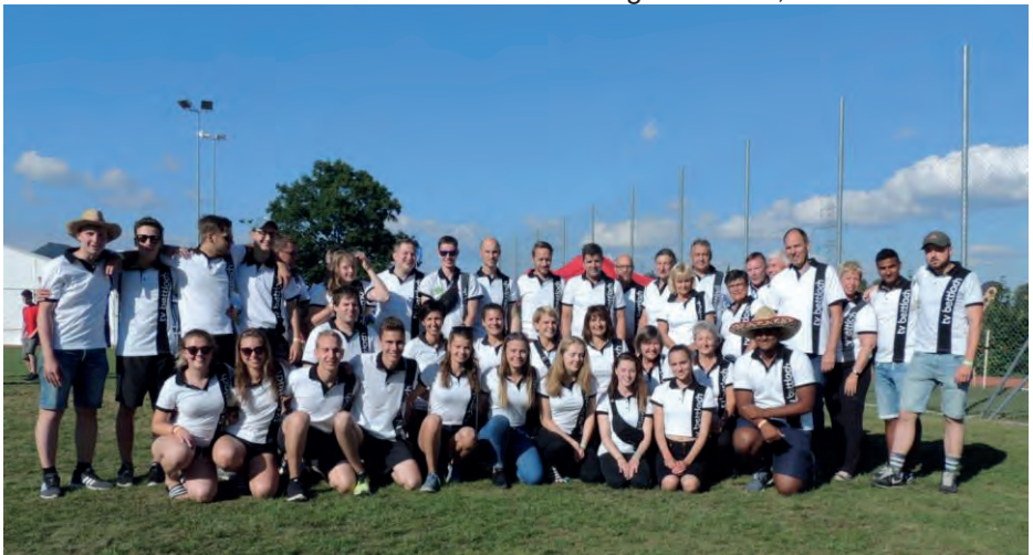
Turnerinnen & Turner KTF Obergösgen