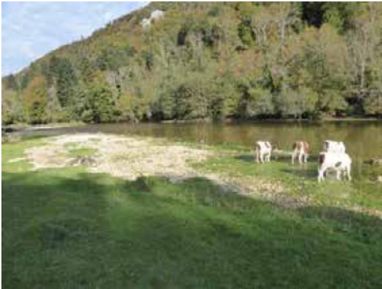
Kühe an der Tränke