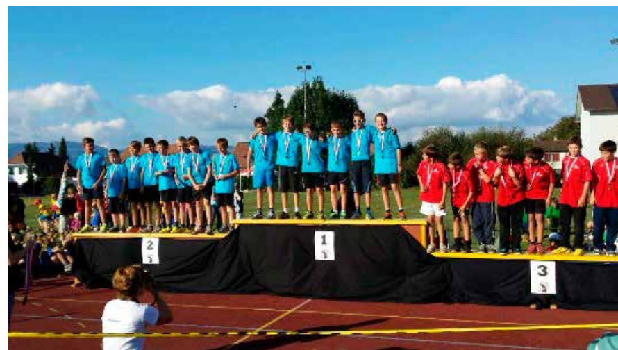
Siegerehrung: 1. Rang TV Bettlach, Knaben Mittelstufe