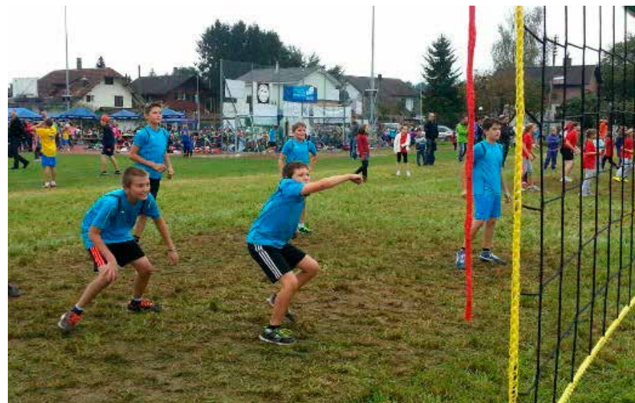
Voller Einsatz beim Ball über die Schnur